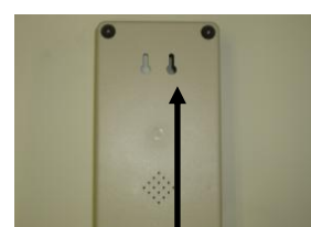
Agujeros para sujetar en la pared